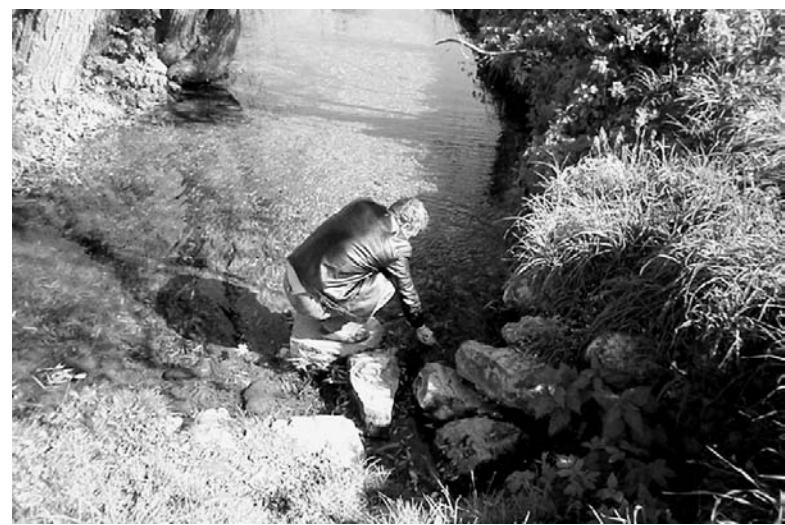
Тропа к роднику не зарастает.

люди, частенько бросая, а кто купит «домик в деревне» куда «только самолетом можно долететь», свое жилье. Но родник готов был продолжать «работать» хотя бы